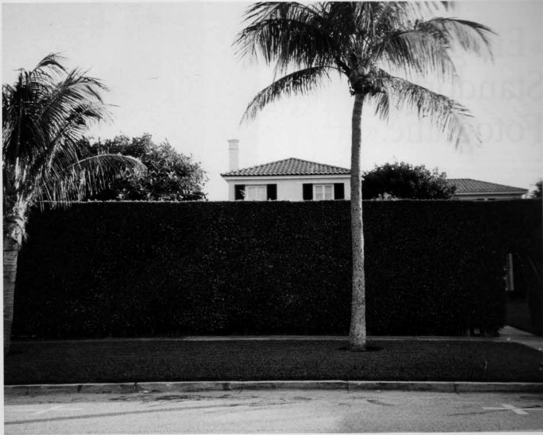
Tom Burr: „Palm Beach Views“, 1999. B S/W-Fotografien

gierte Ankaufstätigkeit wird auch unter Generaldirektor Wolfgang Anzengruber überzeugend fortgesetzt. Anzengruber schätzt an der Sammlung, dass Mitarbeiter Kunst auch am Arbeitsplatz erleben können. Deshalb wird als firmeneigener Präsentationsraum das achtstöckige Stiegenhaus der Verbund-Zentrale Am Hof genutzt: in dieser „Vertikalen Galerie“ sind regelmäßig Ausstellungen mit Werken aus der Sammlung zu sehen, die den Mitarbeitern des Unternehmens und im Rahmen von Führungen jeden Mittwoch um 18 Uhr auch der Öffentlichkeit kostenlos zugänglich sind. Einmal im Jahr sind auch Arbeiten aus den Fotoklassen der Akademie der bildenden Künste Wien, der Kunstuniversität Linz und der Universität für angewandte Kunst Wien zu Gast.